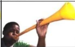
Own team wins