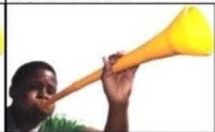
Opposing team wins