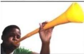
Opposing team scores