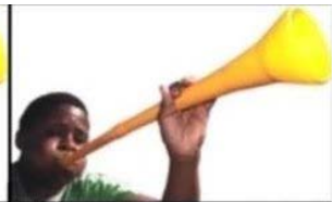
Own team scores