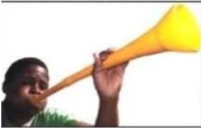
Playing of the national anthem